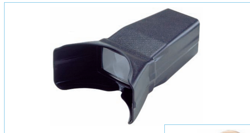
Masque loupe occultant LP4