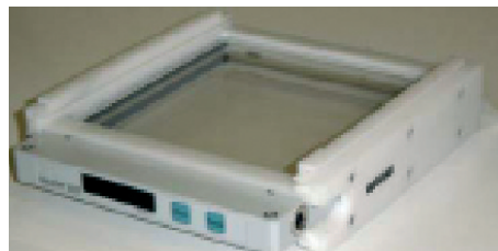
Adaptateur 169 mm pour Philips